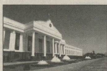
лари тўғрисида»ги Фармонлари оммавий ахборот воситаларини ривожлантиришнинг ҳуқуқий асосларини кучайтиришда муҳим роль ўйнади. (Давоми 2-бетда).

Ахборот соҳаларини жадал ва собитқадам ривожлантириш учун зарур қонунчилик ҳамда норматив-ҳуқуқий база яратилди. Ҳозирги замон талаблари ва демократик стандартларни инобатга олиб «Журналистик фаолиятини ҳимоя қилиш тўғрисида»ги, «Муаллимлик ҳуқуқи ва турдош ҳуқуқлар тўғрисида»ги, «Реклама тўғрисида»ги, «Ахборот эркинлиги принциплари ва қафо-