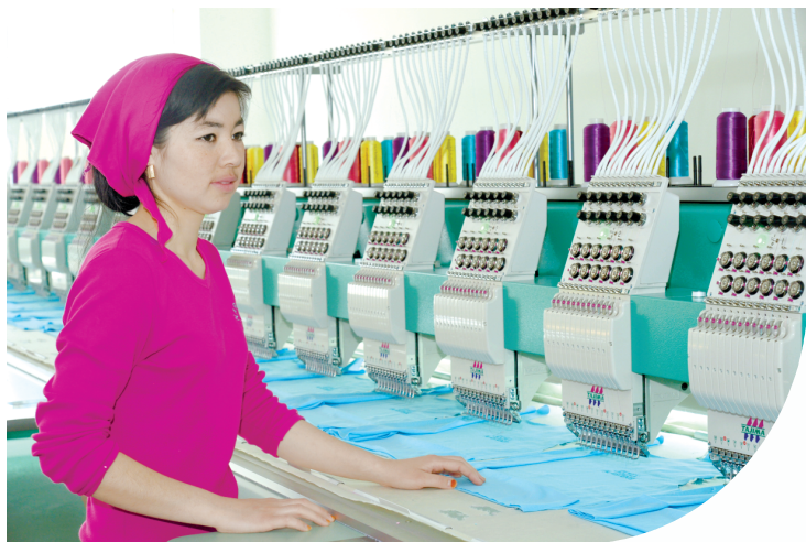
ЎЗБЕКИСТОНДА ИШЛАБ ЧИҚАРИЛГАН

Фаллаорол туманидаги "Nargiza-teks" масъулияти чекланган жамияти — шулардан бири. Ўтган йил охирида фойдаланишга топширилиб, жорий йил бошдан ишлаб чиқариш жараёнига киришган мазкур хўжалик субъекти иқтисодий ночор ҳолатга тушиб қолган собиқ автокорхона ўрнида ташкил этилди. Бунинг учун тадбиркорлар савй-ҳаракати билан 2,5 миллиард сўмлик банк кредити ҳамда таъсисчиларнинг 1,5 миллиард сўмлик маблағи жалб қилинди. Сармояларнинг асосий қисми эса илғор технологиялар харидига йўналтирилди. Албатта, юқори сифат ва нарх-наво мақбулиги — рақобатбардошликнинг бош мезони. Зеро, дунёда молиявий-иқтисодий инқироз ҳали-ҳамон давом этаётган, кўпгина давлатларда иқтисодий ўсиш суръатлари пасайиб, маҳсулотлар оғирлашди қалашиб ётган бир вазиятда ички ва ташқи бозордан мустаҳкам жой эгаллаш ишлаб чиқарувчилар олдида янгидан-янги вазифаларни қўяётгани ҳеч кимга сир эмас.