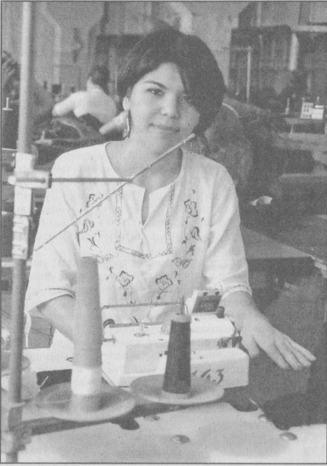
16 YIL O'ZBEKISTON MUSTABILITE - INDEPENDENCE - BARBERLIK