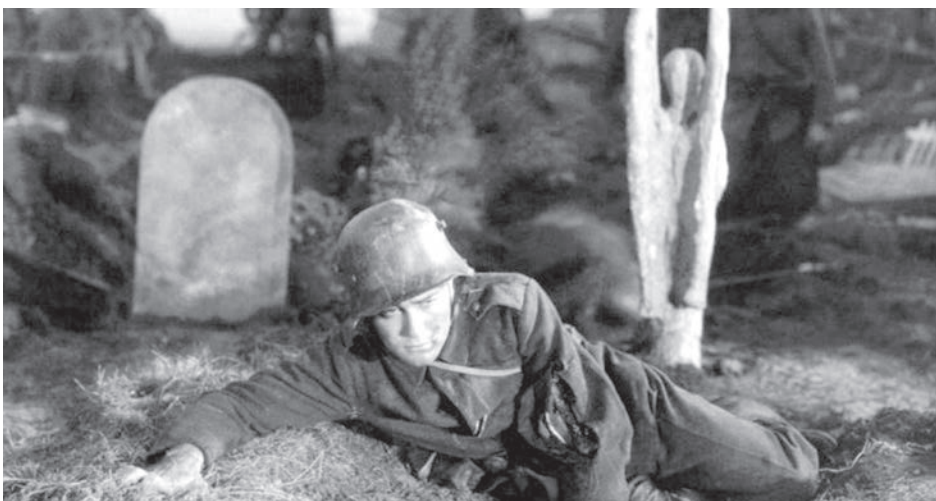
Мазкур роман асосида суратга олинган «Ғарбий фронтда ўзгариш йўқ» фильмидан лавҳа.

«Айтишларича, умрнинг дастлабки етмиш йилини яшаб олиш қийин. Ундан у ёғи силлиққина кетади». Эрих Мария РЕМАРК