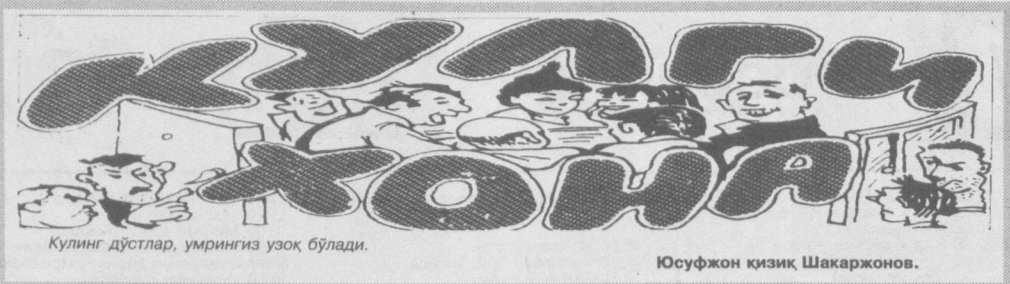
Юсуфжон қизик Шакаржонов.