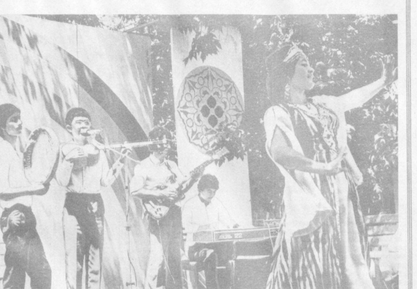
М. НУРИДДИНОВ фотоси.

СУРАТДА: концерт пайти. М. НУРИДДИНОВ фотоси.