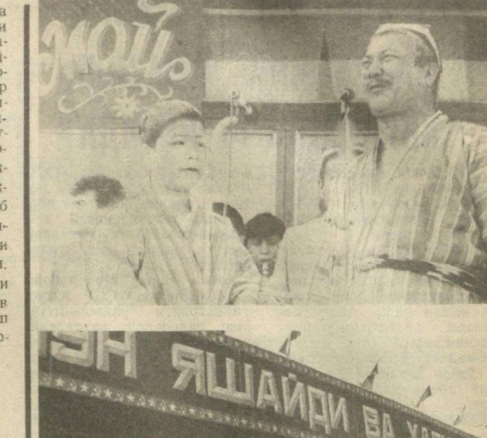
СССР ПРОКУРАТУРАСИНING Т. Х. ГДЛЯ РАҲБАРЛИГИДАГИ ТЕРГОВ ГУРУҲИ ИШИ ТЎҒРИСИДА

ляпти, қонун олдида ҳамма — одил фуқаро ҳам, юқори мансабдор шахс ҳам баравар эканлигини унутиб қўймоқда. Одил судлов жазолаш, ўч олиш, унга татсиб кўрсатишга қодир ҳар қандай каттақонуний хохиши-иродасини ифодаловчи қурол бўладиган вазиёта хотима бериш керак. Нодемократик усуллар билан демократик давлат барпо этиб бўлмайди. Ноқонуний воситалар билан қонунчиликни қарор топтириб бўлмайди. Биз СССР прокуратураси ва Т. Х. Гдьянинг тергов гуруҳи ишларини ўрганиш чоғида ана шу принципларга амал қилдик.