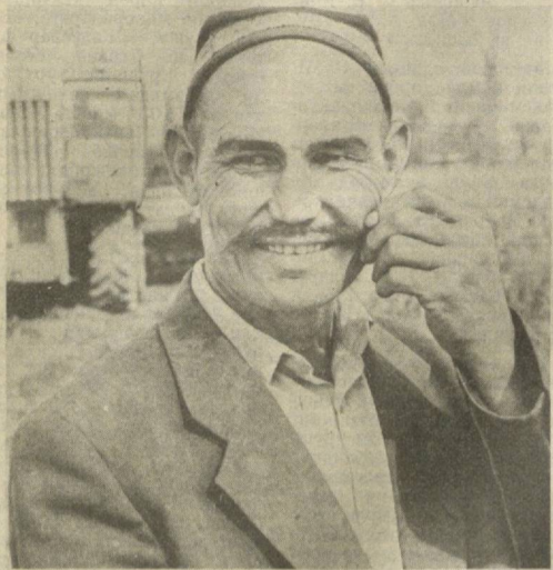
Булуғгур районидagi Хамид Олимжон номи совхозда Умир Очлов номини барча хурмат билан тила олди...