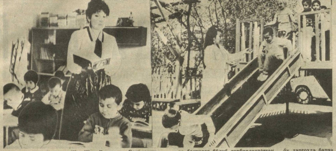
Француз мутафаккири Жан-Жак Руссо: «Болаларни сезил, уларнинг ўйин ва эрмакларига, мурғаканга табиий тўғиларига эътибор беринг!» деган эди. Наманган об-ласт Чуст шаҳридаги «Гунча» болалар беччасида бў-лган, буюк ёзувчининг ана шу гаплари боғишда эси-нига келди. Меҳнаткашларнинг 245 фарзанди соғлом ва бақуват бўлиб тарбияланаётган бу даргоҳда барча шароит яратилган.

камадилар. 52-дақиқада Сергей Родионов дарвозани аниқ нишонга олди. Биринчи лига мусобақала-рида навбатдаги тур учра-шувлари ниҳонига етди. Уйинлар жадвалида ўзгарти-риб берди. Масалан, 14 очко тўплаган Запороженинг «Металлурги» командаси я-на лешадам бўлиб олди. Сафарда зафар қўнган Ор-жоникиде сартакчилари ўз очколарини ўз иккитига ет-киндилар. Жанубий Корея терма ко-мандаси билан Чонжу шаҳ-рида бўлиб ўтган иккинчи учра-шувини олайлик. Ҳисоби-ни 15-дақиқада ярим ҳисоб-ни Пеннадий Морозов очди. Орадан кўп ўтмасдан мохир ҳужумчи Сергей Родионов ҳисобни 2:0 га етказди. Шундан сўнг майдон эгала-рининг омади келди. Улар ҳисобни ўзгартирдилар — 1:2. Иккинчи бўлимда вазиет ўзгармади. Спартачилар учинчи тўпни киритиб, ўз муваффақиятларини мустақ-