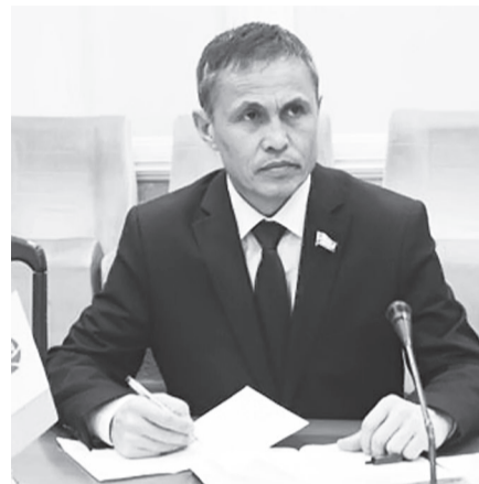
Абдиғани УМИРОВ, Олий Мажлис Қонунчилик палатаси депутати

Масалан, амалдаги қонунда фақатгина давлат статистика органлари фаолияти тартибга солиниб, статистик маълумотларнинг бошқа ишлаб чиқувчилари фаолияти инobatга олинмаган. Статистика маълумотларини ишлаб чиқувчи бошқа давлат органларининг вазифа ва функциялари акс эттирилмаган. Статистик маълумотларни ишлаб чиқариш, улардан фойдаланиш ва эълон қилиш бўйича барча ишлаб чиқувчилар учун умумий тартиб-қоидалар ўрнатилмаган. Статистика соҳасида кўп қўлланиладиган расмий статистика, расмий статистикани ишлаб