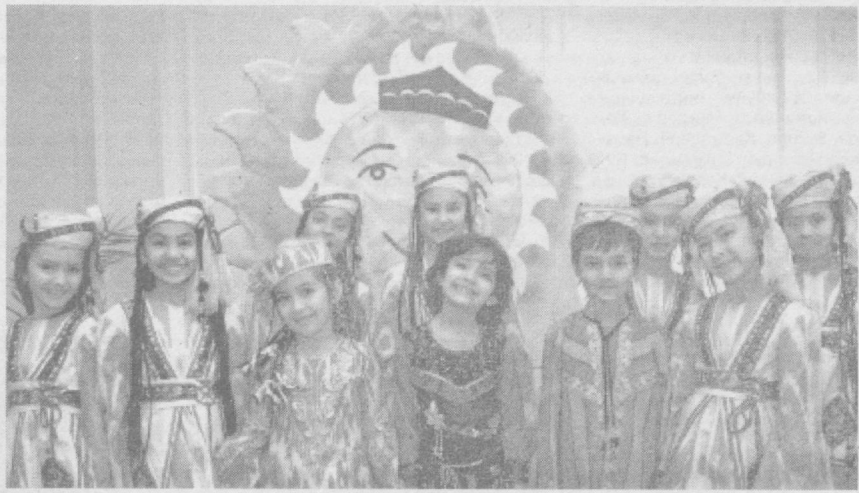
ЎЗБЕКИСТОН ДАВЛАТ КОНСЕРВАТОРИЯСИДА «ЎЗБЕКИСТОН МАДАНИЯТИ ВА САҢЪАТИ ФОРУМИ» ЖАМГАРМАСИ ВА «КАМОЛОТ» ЁШЛАР ИЖТИМОЙ ҲАРАКАТИНИНГ «КАМАЛАК» БОЛАЛАР ТАШКИЛОТИ ҲАМКОРЛИГИДА ЎТКАЗИЛАЁТГАН «ЯНГИ АВЛОД – 2008» БОЛАЛАР ИЖОДИЁТИ ФЕСТИВАЛИ РЕСПУБЛИКА БОСҚИЧНИНГ ОЧИЛИШИ БЎЛИБ ЎТДИ.