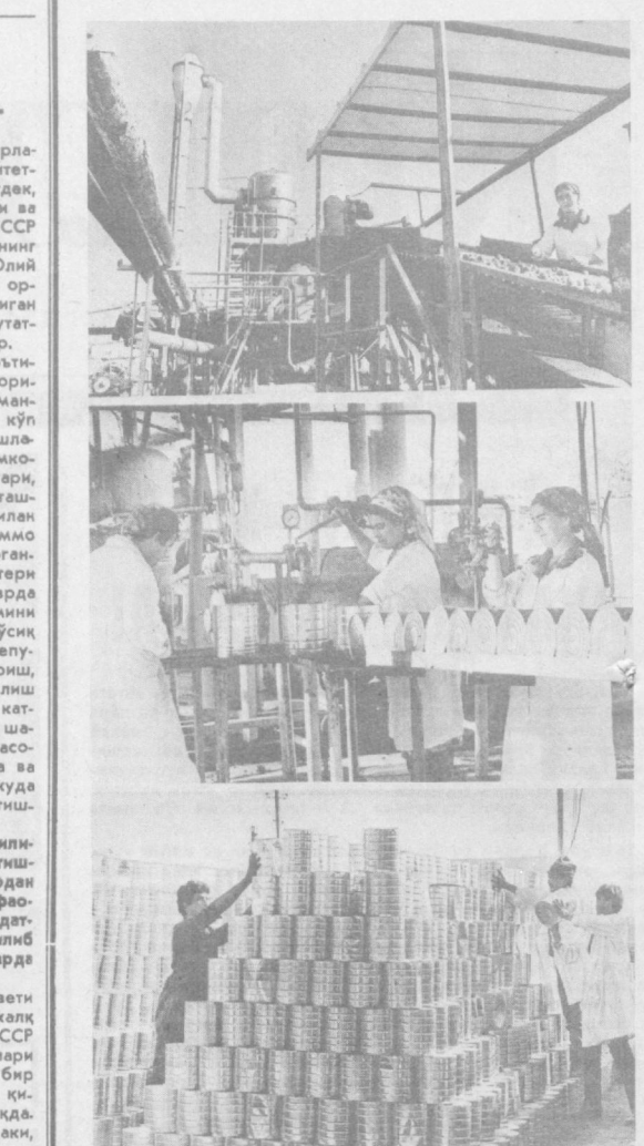
Шу йил ёзда ишга туширилган Шаҳрисабз консерва заводининг Яккабоб филиали суткасига 160 тонна помидорни қабул қилиши мумкин...