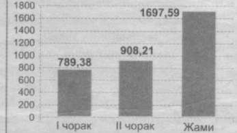
Пластик карталар сони, 2017 йилнинг I ва II чорагида, минг донада

Мамлакатимизда жорий йилнинг II чорагида 908 210 минг дона пластик карта ишлаб чиқилган бўлиб, ушбу кўрсаткич I чорақдагига нисбатан 15,05 фоизга кўпайди. Жорий йилнинг I чорагида ишлаб чиқарилган карталар сони 789 380 мингтани ташкил қилган эди.