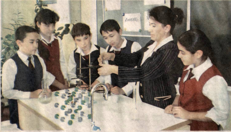
2010 йил — Баркамол авлод йили