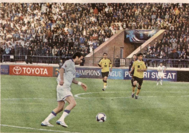
мақсадга мувофиқ, деб ўйлайман.

— Федерация раҳбари сифатида футболни ривожлантириш бўйича жойларда олиб борилаётган ишларни қандай баҳолайсиз?