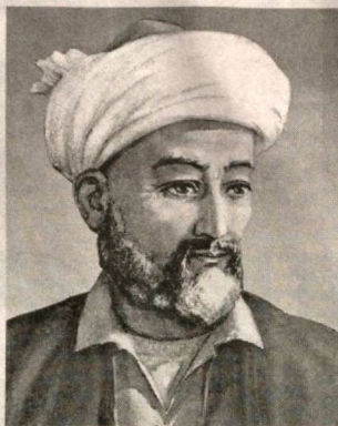
таси юртимизга йўллаган табрик хатида — Алишер Навоийнинг