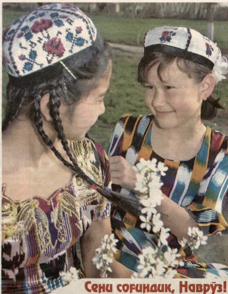
Сени соғиндик, Наврўз!

Мазкур лойиҳа ўқувчи-ёшларнинг билим-салоҳиятини оширибгина қолмай, уларнинг интеллектуал қобилиятини янада юксалтиришга хизмат қилади.