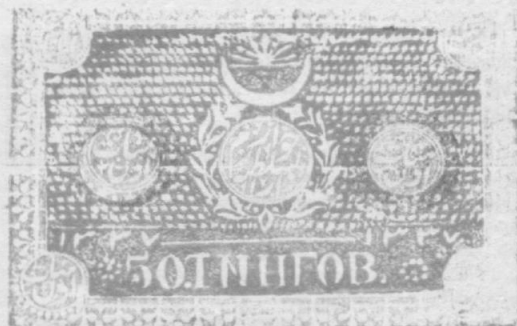
Хива хонлиги, 1918 йил, 50 тангалик

лик, узоқ ўтмишдаги аждодларимиздан бири овчи бўлган ва у ўзи ҳамда оиласига зарур нарсаларни табиатдан олган. Ови бароридан келиб, анча миқдордаги гўштга эга бўлган овчида ҳайвон терилари ҳам тўлланиб қолган. Шунда у қўшни қабилага бориб, ўзидаги терини пичоқ, бугдой ёки ёнғоққа айирбошлаш таклифи билан чиққан. Агар қўшни қабила аъзоларида юқоридаги маҳсулотлар кўп ёки ҳайвон терисига эҳтиёж сезган бўлса, овчи билан келишган ҳолда муваффақиятли айирбошлаш амалиётини юритган. Маҳсулотларни алмашиш орқали ўтказилган бундай амалиёт айирбошлаш (бартер) деб аталади.