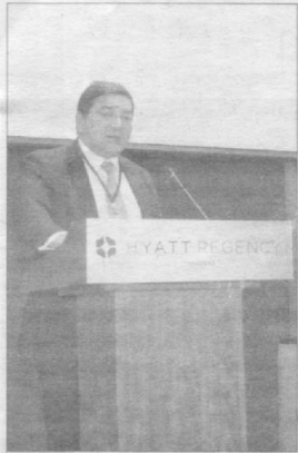
(Давоми. Бошланиши 4-бетда).

Чунончи, Президентимизнинг шу йўналишдаги Фармон ва Қарорларида чет эллик сармоядорлар ҳуқуқлари кафолатлари, хорижий сармоя иштирокидаги корхоналарга татбиқ этиладиган имтиёз ва афзалликлар ўзининг мустақкам ифодасини топган. Шунингдек, у ўз маърузасида ҳуқуқий ҳимоядан ташқари солиқ имтиёзлари, валюта сиёсатининг эркин йўлга қўйилганлиги каби кўплаб имкониятлар хусусида сўз юритди.