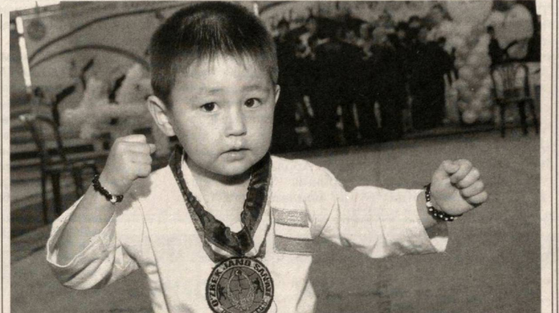
Ким мен билан беллашади?

Муҳандислар мазкур иختиро устида олти йил ишлашган ва улар ўзларининг янги голографик материаллари яқин икки-уч йил ичида кенг қўлланилишига умид қилишмоқда.