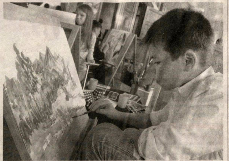
Гўзалликка муштоқ қалблар

У расм чизишга тайёрлаб қўйилган матога бўёқларни итқатадиган мажнун эмасди", дейди кўргазманинг яна бир ташкилотчиси Лео Янсен. Унинг гапларига кўра, Ван Гог санъат ҳақида кўп мушоҳада юритган, мўйқаламнинг ҳар бир чизигини пухта ўйлаб тортган.