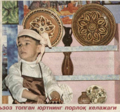
Қадриятлари эъзоз топган юртнинг порлоқ келажаги