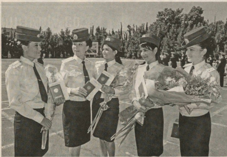
Ватан ҳимояси — муқаддас бурч