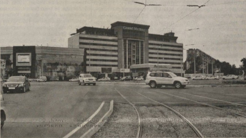
Нозоқат УСМОҲОВА, ЎЗА муҳбири