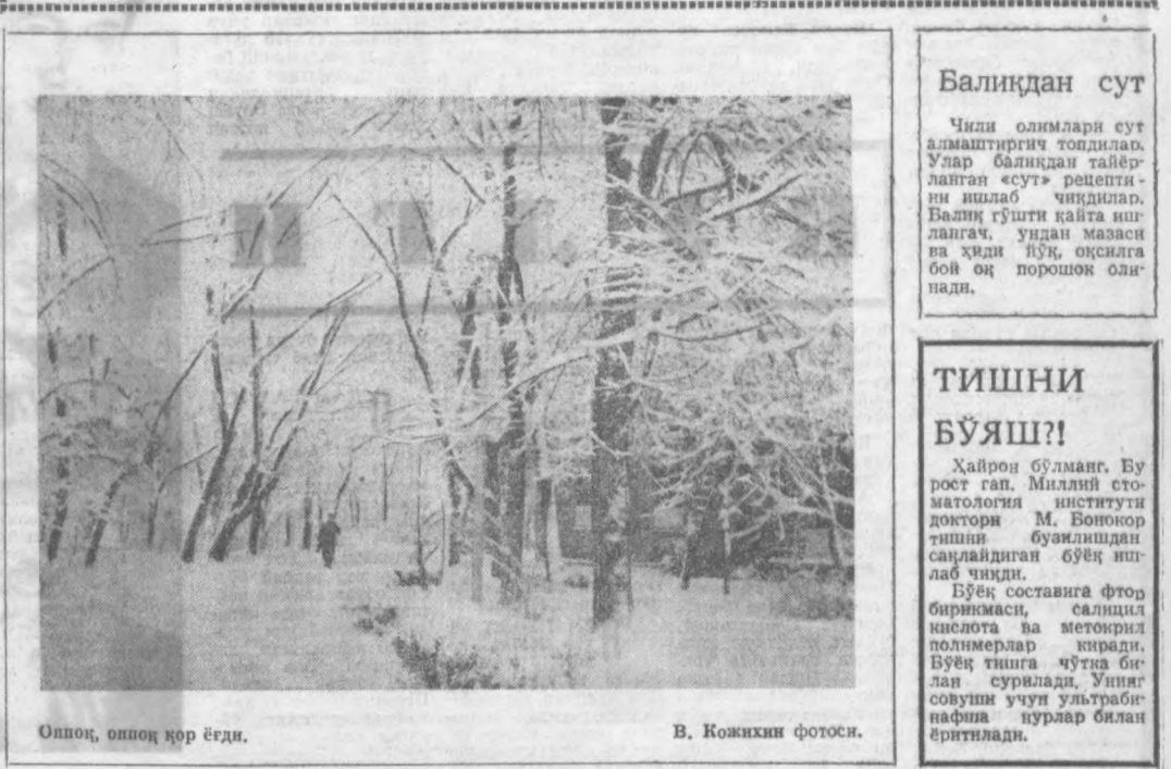
Опоқ, оппоқ қор ёғди.

Икки қўшни арзамаган масала ҳусусида жанжаллашиб қолди. Биринчи берса ҳам, иккинчиси эшитмади. Шундан кейин иккинчи қўшни унга ёрдамга югурди: аҳвол чатоқ унинг обғи чиққан эди. — Қўшини менга опқичин, уйга элтай, кейин бир маслаҳати чиқар, — деди иккинчи қўшни. Биринчи қўшни рози бўлди. Улар уйга келишди. Ойла аъзолари бу юрак ноҳушликдан қайғуришга ҳам, иккинчи ота-қасида ноҳушлик, кек ва гуна уруғининг йўқолганига суюнмишди. Ҳа, ён қўшини — жон қўшини, деганлари шу-да! Адоватнинг турун курси! Уруғини қўшнинг у. САЛОҲИДДИНОВ.