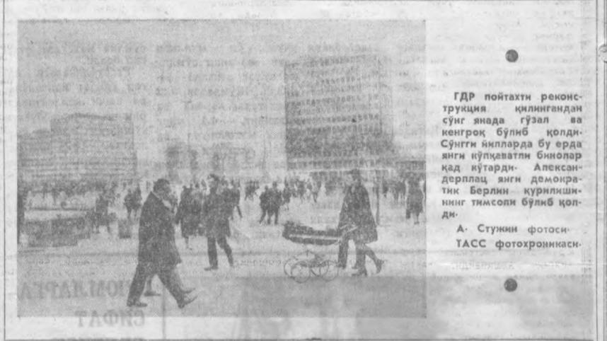
ГДР пойтахти реконструкция қилинганда сўнг андада гузал ва кенгрок бўлиб қолди. Сўнги йилларда бу ерда янги кўчвалли биналар қад кўтарди. Александрплац янги демократик Берлин қурилишининг тямасли бўлиб қолди.

ШИЛНИНГ ЭНГ МУҲИМ ВОҚЕАЛАРИ ТОКИО. «Майнити» гавтаси Совет-Гарбий Германия шартномаси тузилганини, «Луноход-1» нинг ой устидаги сафарини тутаб бораётган йилдаги энг муҳим ўқи халқаро воқеалар қаторига киритди. Осакада «ЭКСПО-70» жаҳон кўргазмаси ўтказилганини гавтаси Япон ороларда 1970 йил ичида бўлиб ўтган энг асосий илтифат деб ҳисоблайди. Гавтасида босилган суратда жаҳон кўргазмасида жуда манзув бўлган совет навильони кўрилиши турнда. «Ленин тузилган қурилиш 100 йиллиги ишхоналанган йилда совет навильонини 28 миллион киши, яъни Япониядаги катта шидаги «аҳолининг деярли ярми»и келиб кўрди.» (ТАСС.)