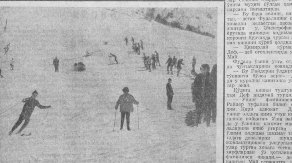
Чимён тоғи этаклари шу кунларда дам олувчилар билан гавжум. Ҳаммаёқ оқлоқ қор билан қопланган. Тоза ҳаво, табиат кишининг ҳордигини чиқаради, руҳини тегтиб қўяди. СўРАТДА: тошкентликлар Чимёнда.