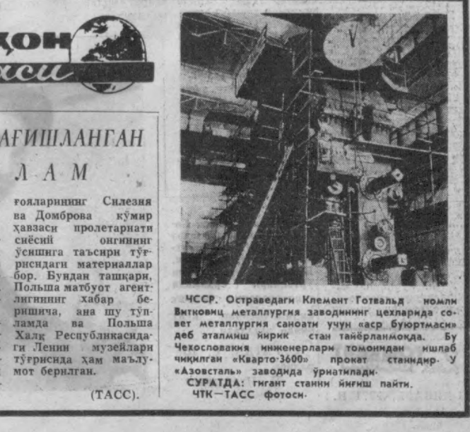
СССР. Остравадаги Клемент Готвальд номли Витковец металлургия заводининг цехларида совет металлургия саноати учун аср буюртмаси деб аталмиш йirik стан тайёрланмоқда. Бу Чехословакия инженерлари томонидан ишлаб чиқилган «Кварто 3600» проект стандартир. У «Азовсталь» заводда урнатилмади. СУРАТДА: гингнт станин йиғилиш пайти.

БАДИЙ КЎРГАЗМА В. И. Ленин номидаги Тошкент Давлат университетининг бош ўқув биносида республика рассомлари ва дайналтарошлари асарларининг бадий кўргазмаси ишлаб турибди. Кўргазмада СССР халқ рассоми Эрол Тансиқбоев, Ўзбекистон ССРда хизмат кўрсатган санъат арбоби П. Чорнев ва бошқа санъаткорлар а р и н и г асарлари намоийн қилинмоқда. Уларда дёрминиз жамоли унинг эконоимисан ва маданияти акс эттирилган. Ўзбекистон ССР Маданият министрлигининг выставка ва панорамалар дирекцияси уюштирган бу кўргазма мин студентлар зўр Р. Чорнев ва бошқа санъаткорлар а р и н и г асарлари намоийн қилинмоқда.