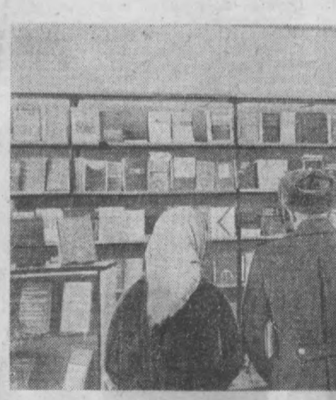
Шаҳримизнинг «Марказ-1» кварталдаги биринчи сон китоб магазини доимо харidorлар билан бағам бўлади. СУРАТДА: магазиннинг бадий ва ижтимоий адабиёт бўлимида савдо пайти.

1971 йил рўзгор холодиликлар заводи учун техника тараққиёти йили бўлади. Ҳозир цехларда иккита янги механизацияланган поток линия урнатилмоқда. Корхона бўйича бажариладиган ишларнинг олтинчи процентини механизациялаштиришга қарор қилинди. «Оазис-3» маркази янги холодиликлар учун мосламалар тайёрлаш суръати яқинлаштириб юборилди. Бу таъминлаштирилган буюмларнинг дастлабки нархиси шу йилнинг тўртинчи кварталда йиғилди. Бу йил заводнинг реконструкция қилиш мўлжалланмоқда. Шундан кейин корхона йилга юз минг тага етказиб холодилик ишлаб чиқара олади. Бунга мавқуд ишлаб чиқариш майдони ҳамда ишчи кучи билан эришилши характерлидир. Юбилей йилида эллик етти минг икки юз «Оазис-2» холодиликлар ишлаб чиқарган ҳамда планга қўшимча 150 минг сулик буюм етказиб берган завод коллективи шу кунларда сьезд шарафига мусобақани қизитмоқда. Уларнинг партиянинг XXIV сьезди шарафига қабул қилган оширилган социалистик мажбуриятда «БИРИНЧИ КВАРТАЛ ПЛАНИНИ 25 МАРТГА БАЖАРИШ БИЛАН ТОПШИРИККА ҚўШИМЧА ИККИ ЮЗТА ХОЛОДИЛНИК ИШЛАБ ЧИҚАРИЛАДИ. МАХСУЛОТ СИФАТИ ҲАМДА МЕХНАТ УНУМДОРЛИГИНИ БИРМУНЧА ОШИРИШГА ЭРИШИЛАДИ» деб қайд қилинган.