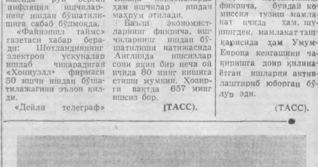
Францияда ички ҳафтадан буйи мисли кўрилмаган совуқ даров этмоқда. Мамлакатнинг кўпгина районларида, айниқса Рона дарёси водийси ва Марназий массивда ҳарорат 27.34 даражага тушиб кетди. Қалин қор ва музлар Франция территориясининг атомобил йўллари-нинг кўпчилигини ишдан чиқарди. СУРАТДА: Монтелимар (Дром департаменти) йўлларида, Шатак енгил атомобилни тортомоқда.

ХЕЛЬСИНКИ. Финляндия Марказ партиясининг парламент фракцияси бошқа партияларга муурожаат қилиб, хавфсизлик масалаларига бағишланган Умумевропа кенгашини қадришга кўнлашмоқ учун парламент комиссияси тузилиши таклифи эъди. Марказ партиясининг фикрича, бундай комиссия тузиш мамлакат ичида ҳам, шунингден, мамлакат ташқарисидан ҳам Умумевропа кенгашини чакришга доир қилнаётган ишларни активлаштириб юборган бўлур эди. (ТАСС).