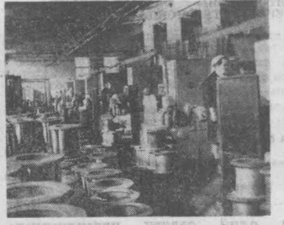
Сиз суратда кабель заводдаги II-технинг умумий қўрилишини кўриб турибсиз. Бу ерда галтакларга сизлар йиғилди.

«Главашкентстройга» қарашли 159-трестнинг 22 қурилиш бошқармаси коллектив беш йиллик ва юбилей йили планини мудафидан олдин бажариб, янги йилги меҳнат муваффақиятлари билан кутиб олди. Пешқадим коллектив партиянинг навбатдаги съезди шарафига йил бошидан соҳа шайқолини мусобақани кучайтириб юборди. Съездин муносиб кутиб олиш юзасидан қурилиш бошқармаси коллектив томонидан қабул қилинган янги мажбуриятда уларнинг режасида аниқ ифодаланди. Бошқарма биринчи квартал планини 24 мартга бажаришни мўлжаллаб турибди. Қурувчилар квартал планига қўшимча 40 квартирани уй, болалар ёғочлари ва бошқа объектларни қуриш ишлари билан банд. Бунинг учун барча имкониятлар ҳисобга олиб чиқилган. Умумий майдонни икки минг етти юз квадрат метрдан иборат бўлган 56 квартирани уй билан, Чилонзордаги уй-жой куриш кооператив пайкарига қурилишда ёрдам бериш уларнинг биринчи даражали вазифасидир. Қурилиш материалларидан тежаб-терғаб фойдаланиш туғайли 150 кубометр қоршима, 50 кубометр тахта, 50 тонна цемент, 2600 дона ишт тежаб, 80 килограмм микс, 80 киловатт-соат электр энергияси тежаб қолди. Иш вақтида юксак кўрсаткичларга эришиш ва ишчи илмий асосда ташкил қилиш туғайли механизм ва автоматизациянинг бекор туриб қилини 15 процент камайтирилади. Бригада ва участкаларга бирикитилган ишчилардан йигирма кишига ҳунар ўргатилиб, ўттиз илмининг малакасини ошириш қўзда тутилди. Ҳозир бошқарма коллектив мўлжалланган ишларни амалга ошириш учун барча тадбирларни қўламоқда.