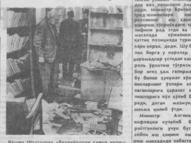
Қўшма Штатларда «Яхудиёларни химоя қилиш логиси» деб аталмиш сионистик ташкилотнинг безорилари томонидан қидирилатган бешошлилар давом этмоқда. СУРАТДА: Нью-Йоркдаги Америка-Совет дўстлиги жамаитининг хонаси «Яхудиёларни химоя қилиш логиси» безорилари ҳужумидан сўнг шундай ҳолат тушди.

ХАНОЙ. Ханой матбуоти республика пойтахтининг 1970 йилда махсукуни шўлаб чиқариш ақуналарини кенг ёритмоқда. Газеталарнинг хабар беришича Ханой маҳаллий санаот қорхоналари махсулотининг ҳажми 1969 йилдаги нисбатан беш процент кўпайган. Кенг истеъмол моллари ишлаб чиқариш 13 процент ортган. Озиқ-овқат саноати яхши натижаларга эришди. Утган йили бинокорлик материаллари ишлаб чиқаришга айниқса Катта эътибор берилди. Илпакчи план етти процент ошириб бажарилди. (ТАСС).