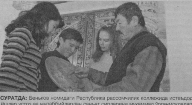
СУРАТДА: Беньков номидаги Республика рассомчилик коллежида истеъодли ёшлар устоз ва мураббийлардан санъат сирларини мукамил ўрганмоқдалар.

тирилган давра суҳбати «Миллий истискол гоёси ва мафқураси» деб номланди. КЕЧА Мирзо Улуғбек номидаги Ўзбекистон Миллий университети қошидаги академик лицейда Халқаро «Олтин мерос» жамғармасининг ходимлари ҳамда лицей ўқувчилари иштирокида учрашув уюштирилди. (Тошкент шаҳар ҳокимлигининг Ахборот хизмати ва ўз мухбирларимиз хабарларидан).