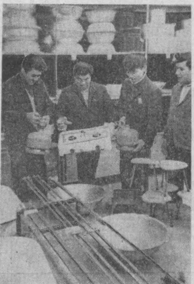
Шахримзининг Муқимий кўчасидаги 47-хўжалик ва маданий моллар магазини коллективидан аҳолига намунали хизмат кўрсатмоқда. СУРАТДА: магазиннинг рўзгор-буюмлари бўлимида савдо пайти.

Тошкент моделлар уйи устибощ конструкторлари «Пелакс» синтетик газламасидан тинкилган, эркаклар киёди, қанч янги пальто ва курткаи моделларини таклиф этишди. Республика бадний кенгаши экспертлари томонидан юнсан баҳога сазовор бўлган буюмлар Тошкент «Кизил тоғ» тикувчилик фабрикасига инвентар этиш учун топширилди, Ўзбекистон енгил саноати корхоналари бу