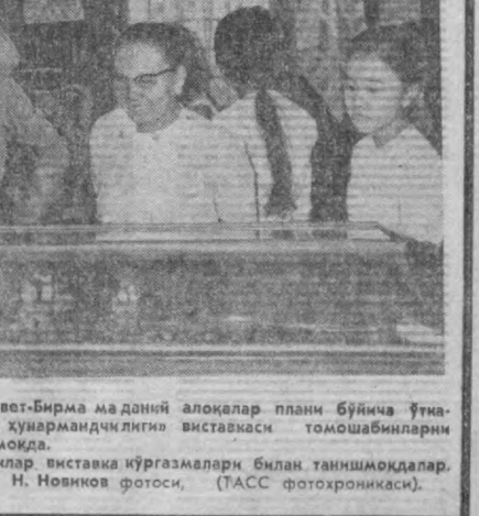
БИРМА. Раигунда Совет-Бирма маданий алоқалар пилани бўйича ўтказилган «Россия халқ хўнарамчиликни» выставкаси томошабинларни ўзига қўллаб жалб қилмоқда. СУРАТДА: рангунликлар выставка кўргазмалари билан танишмоқдалар.

Ун болали оналардан М. Исҳоқова, А. Эрматова ва бошқалар мукофотларни қувонч билан олар эканлар, партия ва ҳукуматимизга бўлган санимий миннатдорчиликларини изҳор этдилар.