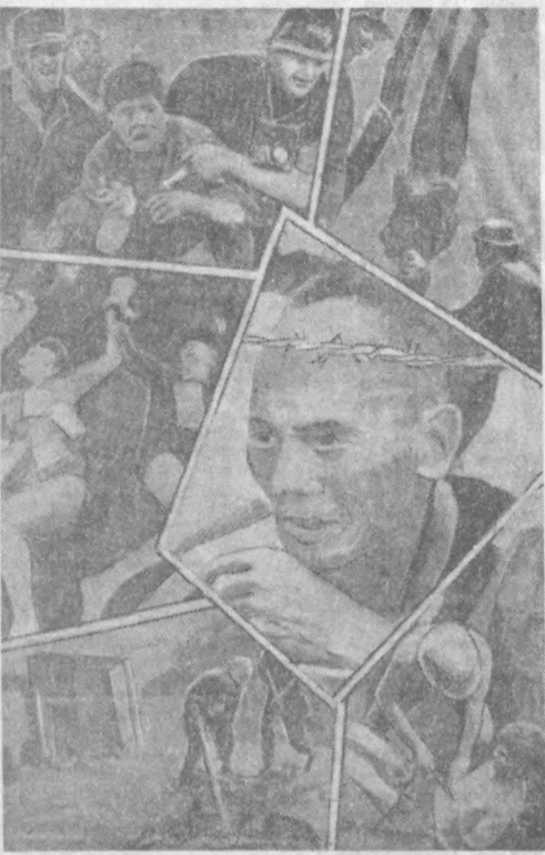
Мана америкалик вахшийларнинг кривдорлари.