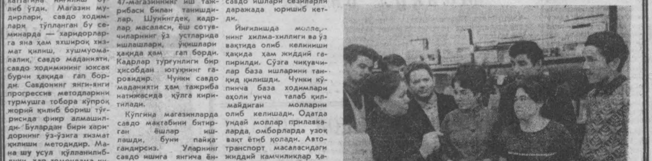
Шота Руставели ва Муҳимий кўчаларини муолазиматида 47-магазини кўпчилик билди.

Семинар катташчилари шахримиздаги энг яхши ва кўп тармоқли