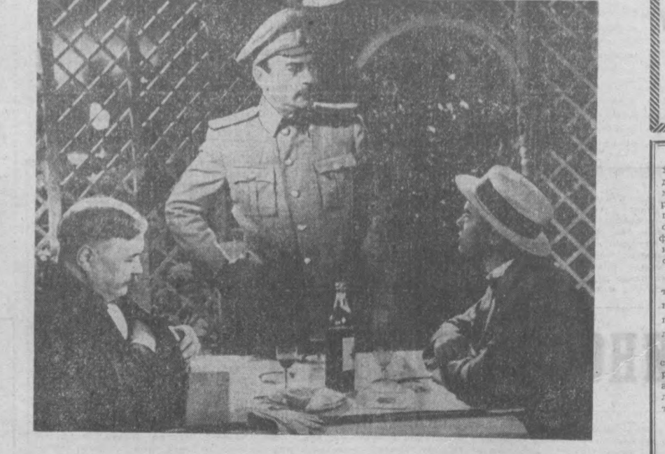
ДМИТРИЙ НАГИШКИН романи асосида ишланган. А. ДОВЖЕНКО номли киностудия маҳсули. ФИЛЬМ ҚИЗКАРЛИ ФОРМАДА УЗОҚ ШАРК КОМСОМОЛЛАРИНИНГ 1918-1922 ЙИЛЛАРДА ЯПОНИЯ-АМЕРИКА ИНТЕРВЕНТЛАРИГА ҚАРШИ ОЛИБ БОРГАН ҚУРАШИ Тўғрисида ҲИКОЯ ҚИЛАДИ.