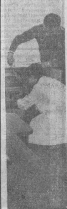
Тошкент сейсмология институтинда янги электрон-ҳисоблаш техникаси бўлими ташкил этилди. Ҳозир «Минск-22» электрон-ҳисоблаш машинасининг монтаж қилиш ишлари оlib боришмоқда. Бу — аниқланган энциклтри ва кучини аниқлашни оsonлаштиради.