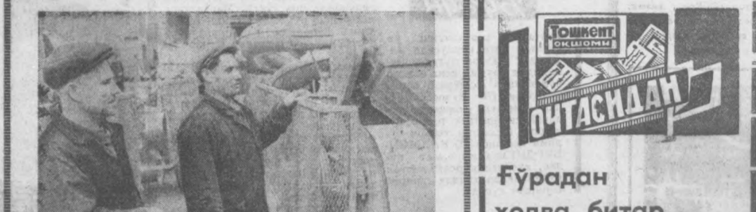
«Узбексельмаш» заводининг машинасозлари мамлакатини пахтакорлари учун ҳам йилги минглаб турли хил қишлоқ хўжалик машиналарини ишлаб чиқармоқдалар.

РИМ. Италия Коммунистик партиясининг 50 йиллигига бағишланган материаллар босиб чиқарилган «Унита» газетасининг янги нусхадда тарқатилди. Газетани бутун Италия бўйлаб кенг тарқатиш кампаниясида коммунистик жабуоти дониш тарқатувчиларнинг минглаб вакиллари, партия активистлари, партия студентларнинг кўпдан-кўп гуруҳлари иштирок этидилар.