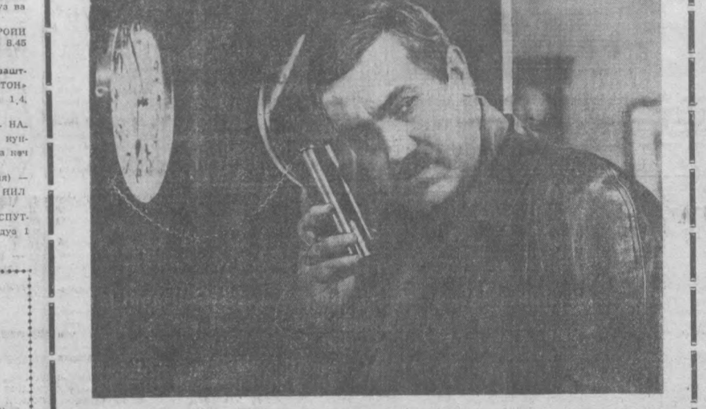
БУ САРГУЗАШТИ ФИЛЬМ УЛУГ ВАТАН УРУШИНИНГ БОШЛАРИДА ЧЕКИСТЛАР ТОМОНИДАН ҚЎПОРУВЧИЛАРНИ ҚўЛГА ТУШИРИЛИШИ ҲАҚИДА ҲИКОЯ ҚИЛАДИ.

«ЛЕНФИЛЬМ» киностудияси маҳсулот. Постановкачи — режиссёр — Григорий АРОНОВ. Сценарий муаллифи — Феликс МИРОНЕР.