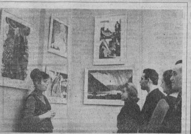
МОСКВА, РСФСР Бадний фондининг Москва графика санати бўлими КПСС XXV съездида поитат графика-расмлари томонидан ишланган эстамплар выставкасини очди. Бу кўргазма клублар, ўқув юрталар ва корхоналарда намойиш қилинади.