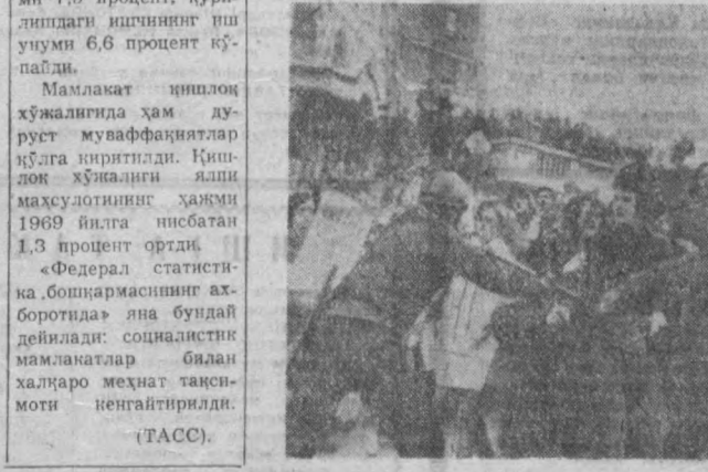
Жанубий Вьетнамда АҚШнинг доимий қўшиқлари турши бу районда кесипилини юмшатишнинг ҳозирда ҳаммага аён. Бундан ташқари урушининг давом этиши америкалик солиқ тўловчи

Аниқ вақтда майда ва ўрта соҳибкорлар ўртасида ваҳима тарқатиш, уларда ҳўкумат сўбатидан норозилик нафратини вуқунга келтириш, Чили экономикасига путур етказиш ва шу тарика граждандар уруши чикериш учун кулай вазиат яратиш мақсадида имкони бўлганда ҳамма ишлар қилинмоқда.