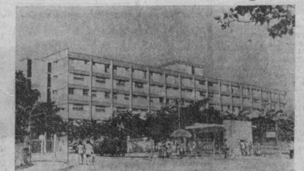
КУБА. Олығндаги В. И. Ленин номи клиника Орьенте вилоятдаги ирик шифохона бўлишига қўйлаб, бални медицина кадрларининг ўчоғи ҳамдир. Шифохона барпо этилгандан бунён озлаб врачлар, медицина ҳамширалари, техника мутахассисларини таъйирлаб чиқарди. СУРАТДА: Олығндаги В. И. Ленин номи клиника.

даги меҳнаткашларнинг умумий пули 291 миллион 367 миң сўмга етди. Бу рақамлар кишиларнинг турмуши фаровонлашиб бораётганидан далолат бериб турибди. Аҳолига 38 миллион 419 миң сўмлик 3 процентли давлат ички ютуқ заём облигацияларини сотилди. Меҳнаткашларга ана шу облигациялардан ўтган 1970 йилнинг ўзида 1 миллион 740 миң сўм ютуқ пуллари тўланди.