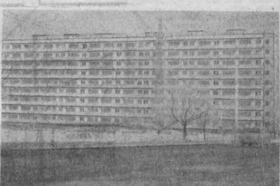
Бу бино Чилонзор районидagi «Ташсовет» 50-йиллиги номи ки-нотеатр билан ёна-ён қад қўтарди. Уни 6-трест, 27-қурилиш бош-қармасининг бинюкларни қурмоқдалар. Бу тўққиз қаватли уйга кў-чиб кирувчилар учун бинюклар барча қулайликларини яратмоқ-далар.