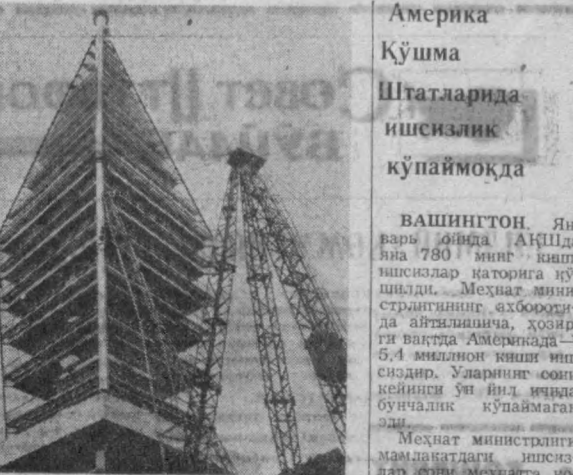
СССР, Братислава. Суратда: янги телевизион марказининг баландлиги 192 метр бўлган амморас қурилиши.

ВАШИНГТОН. Январь ойида АҚШда яна 780 миң иш-сизлик каторига қў-шилди. Меҳнат ми-яна-стриянинг ахбороти-да айтадики, ҳозир-да Валтис Американи-да 5,4 миллион иш-сиз-лик каторига қўйилган. Уларнинг ости-кейинги ўн йил ич-да бунчалик кўпайма-ган эди. Меҳнат министрлиги маълуматидан иш-сиз-лик сони меҳнатга қў-биланган қанча аҳо-ли-нинг 6 процентини ташкил этди, деб таъ-кидлади. (ТАСС).