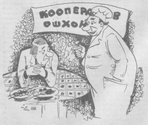
Нега оқатларингизнинг мазаси йўқ, бунинг устига киммат!