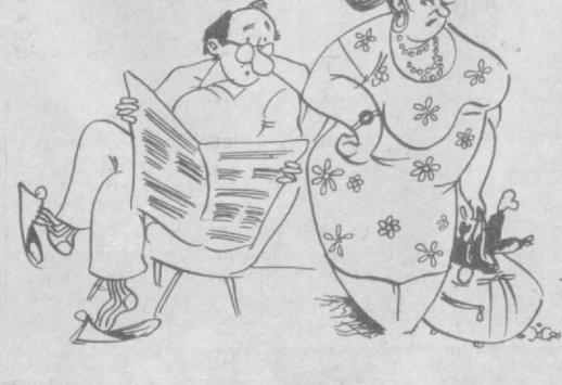
Мудиримиздан кам маош олсам-да, ундан кўп ташинман, дадаси.