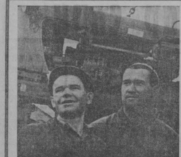
Тошкент тракторсозлик заводи коллективини ҳам янги йилни меҳнат соҳа-сида катта муваффақият-лар билан кутиб олди. Тракторсозлар йиллик маҳсулот ишлаб чиқариш топширинини муддатдан илгари адо этдилар. Йил давомида улар Ватанга 20 мингта яқин аъло си-фатли тракторларни ар-мугон этдилар.

«Тошкент оқшоми» газетасида босил-ди чикан академик Яхў Ёлмоловнинг «Чой ва чойхона излаб» мақоласида келтирилган фактларга ҳам, мулоҳаза-ларга ҳам тўла қўйилган. Ҳақиқатда ўзбекларнинг дам олиб ҳордиқ чикара-диган, шахмат-шашка ўйнайдиган, ашу-дада ешитиб, аския айтмайдиган чойхоналар и-нейинги йилларда «Чайна»ларга айлан-ди кетди. Қани эди уша чайналарда бир стақан чой топила. Бунада станка-ларга бошқа нарсалар қўйилди.