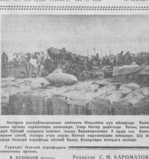
Нигерия республикасининг пойтахти Ниамайга куз ойларидида балкичлик артели қаровонлари келишди. Улар Нигер дарёсида балкич олаб, дарё бўйлаб юзюргани пойтахт томон бораверишди. У ерда эса балкичларнинг сотиб, узлари учун керак бўлган нарсалардан олишди. Шу ойларда Ниамай атрофида қўлаб балкич бозорлари вужудга келди.