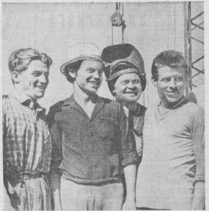
«Ригажилстрой» трестига қарашли қурилиш по- эзднинг бинокорлари Чилонзорнинг К-24 квар- талида Латвия кварталини бунёд этаётқилар.

Унинг кўнглида пахта- ликни ривожлантириш- га оид бир қатор қим- матли материаллар тў- пиланган ва атрофича таҳлил қилинган.