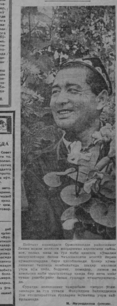
Пойтахт яқинидаги Оржоникиде районининг Ленин номи колхозини шаҳаримиз аҳолисини сабабот, полив, мана ва гул каби қишлоқ ҳўжалик махсулотлари билан таъминлашни асосий йирик ҳўжаликлардан бири ҳисобланади. Ҳозир ҳўжаликнинг тегилида қанчалар шаҳар аҳолисини учун яққ пива, бодирин, помидор, лимон ва апельсин каби махсулотлар ҳамда бир неча мийга тузук рангбаранг безак гуллари етиштирилмоқда.