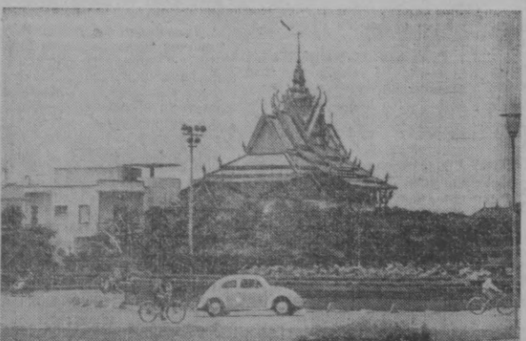
КАМБОДЖА. Мамлакат пойтахти Пном-Пень кўчаларида.

ГАРБИЙ БЕРЛИН. (АПН мухбири). Почта-телеграф буюми билан бирга Мюнхендан келган янги рақибнинг кўчирмаси ҳам келтирилди. Унинг ичидан турта тасвирланган жигар ранг рақиб ва вақтнинг ўтиши билан жигар ранг рақибнинг ўзгариши ҳам кўрсатилган. Бу «Дойче националь-унд зольдатеңцайтунг»нинг ўзгариши билан жигар ранг рақибнинг ўзгариши ҳам кўрсатилган. Бу «Дойче националь-унд зольдатеңцайтунг»нинг ўзгариши билан жигар ранг рақибнинг ўзгариши ҳам кўрсатилган.