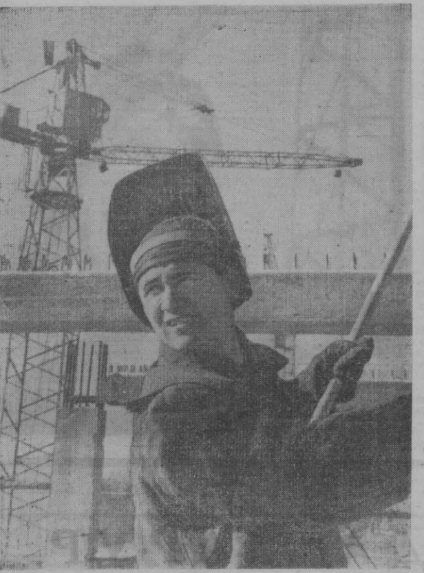
В. И. Ленин номли Қизил майдонда 11-қурилиш трестига қарашли 17-қурилиш бошқармасининг моҳир қурувчилари кўпқаватли маъмурий бинони барпо этмоқдалар.

Бошқарма меҳнатсеварлари бу бинони Октябрнинг 50 йиллигига қуриб битказишмоқчи.