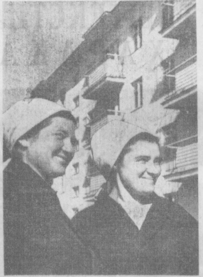
Пойтахтни қайта тинлаётган қардош бинокорлар сафида киргизистонлик қурувчилар ҳам ҳисса қўшмоқдалар.