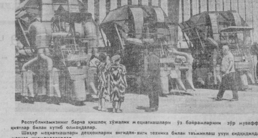
Республикамизнинг Барча қишлоқ хўжалик меҳнатқашлари ўз байрамларини зўр муваффа- қиятлар билан кутиб олмоқдалар.

Шаҳар меҳнатқашлари деҳқонларни янгидам-янги техника билан таъминлаш учун ендиқилди меҳнат қилмоқдаларлар.