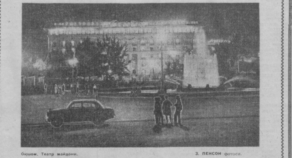
Ойшом. Театр майдони.