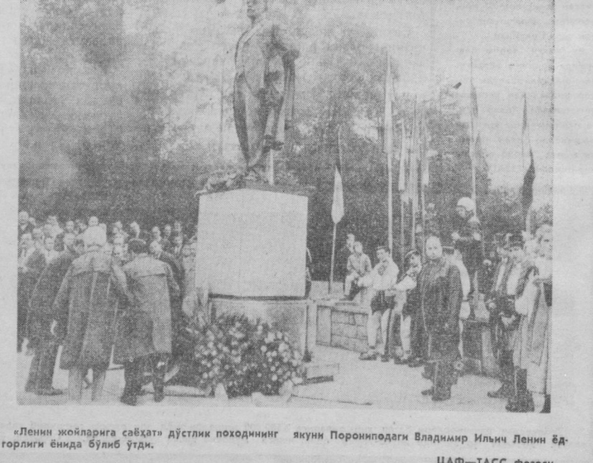
«Ленин жойларига савҳат» дўстлик поҳодининг яқини Поронподоги Владимир Ильич Ленин ёдгорлиги ёнида бўлиб ўтди.

Югославиялик мутахассислар кўмирдан ярим целлюлоза олиш йўлини ишлаб чиққилар. Мазлумки, бу моддалар оддий ёғочдан 60-65 процент микдорда олинади, кўмирдан эса тахминан 38 процент микдорда олинади. ҚУЙЛАЙДИГАН СИНФ ДОСКАСИ Яқинда Лондондаги машур музика салонида «қуйлайдиган синф доскаси» намойиш қилинди. Қуячилар доска ердимида нота билан эзилган овозни тингашлари мумкин. Доскада осон алмаштириладиган нота белгилари бўлиб, нота чиққилари орасидаги ёриқча қўйилади. Укитувчи қилдиган метал тақвча нота белгиларига тегиши билан маълум электр занжири тушади ва тақвча билан мақур нотадаги тегишли овознинг чиқишга ердм беради.