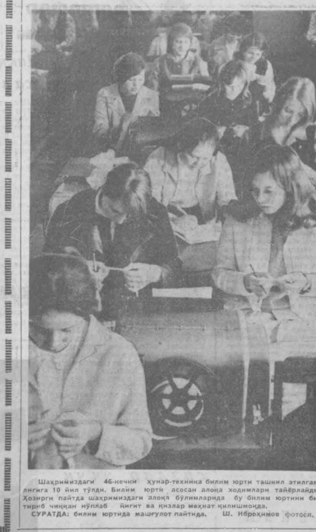
Шахримиздаги 46-ночи хунар-техника билим юрти ташкил этилганлиги 10 йил тўлиди. Билим юрти асосан алоқа ходимлари тайёрлади...