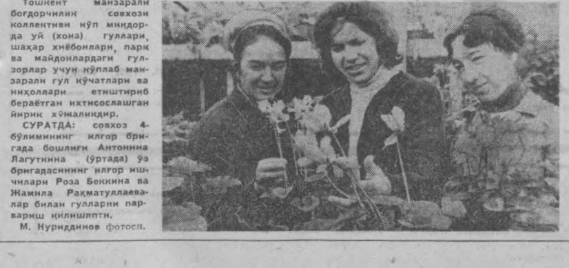
Тошкент манзарали бодорчилик совхоз коллективини кўп миқдорда уй (хона) гуллари, шаҳар жибонлари, парк ва майдонлардаги гулзорлар учун кўплаб манзарали гул нўчалари ва нихоллари — етиштириб бераётган иختисослашган йирик хўжалиқлар.