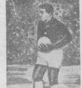
Сизга қачондир спорт соҳисидеги биографиянгиз туғарида ҳеч ўйлаб қўрганми-сиз?

— Спортда голиб чиқини орзу қилган ўйинчида нима деб наслатқ берардингиз? — Кўп йилда, деб наслатқ берардим. Ҳеч нарсга ўз-ўзидан келмайдди. Муваффақият — бу аста-секин йиғилган мукамаллик ва у осонлик билан қўлга киритилмайдди. Одам уч яшарингидан бошлаб футбол ўйнай олади. Тасавурида мен қўлимда футбол тўпи билан бирга туғилгандайман. Бутун ҳаётим тўп тешиш билан ўтмоқда.