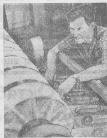
«Учқун» тўғримақиллик-галангерей буюмлари фирмаси пойтахтда ва республикада биринчи бўлиб янги усулда ишлашга қўнрақлиги ва киста вақт ичида катта ютуқларни қўлга киритди. Янгица фирма моқисиз тўғримақиллик янги усулларни олди.

Ишлаб чиқаришда тежамдорликни эриштириш, мизга даъват этувчи кўнрақлиги аниқланди.