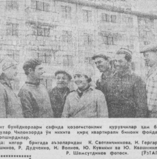
Тошкент Бунёдкорлари сафида қозғонистик курувчилар ҳам бор. Яқинда улар Чилонзорда уи ниқига кирк кваттирли бинонини фойдаланишга топириқдилар.