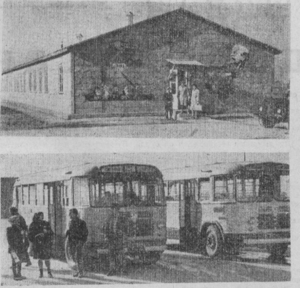
1. Мана янги мактаб ҳам тайёр. Кенг синф хоналари, шинам кабинетлар, дастлабки та-даларини қабул қилишга тахт. Ҳўтутувчилар ва ўқувчилар қизғин мактаб ҳаётининг бошла-ниб кетилиши сабрсизлик билан кутмоқдалар.