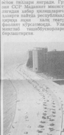
Грузиянинг Қора денгиз соҳилида жойлашган шифо масканлари бутун оламга машҳур. Ана шу жойларда ҳар йили минглаб совет ва чет эллик граждандар даволаб, ҳордиқ чиқарадилар, саломатликларини мустаҳкамлайдилар. СУРАТДА: Пицунда курорти.