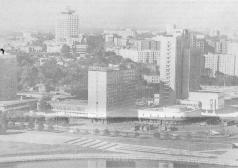
СУРАТДА: Минск шаҳрининг умумий кўриниши.