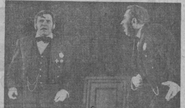
Максим Горький номидаги рус давлат академик драма театрида «Суд иши» номидаги спектакль томошабинлар эътиборига ҳавола этилди.