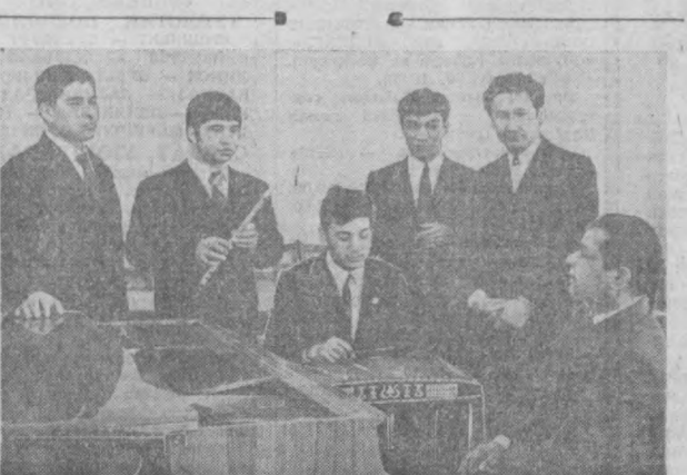
Ўзбек халқ чолғу асбоблари ва баян бўйича ёш ижроичилар 2-республика конкурси қатнашчиларидан бир гуруҳи.