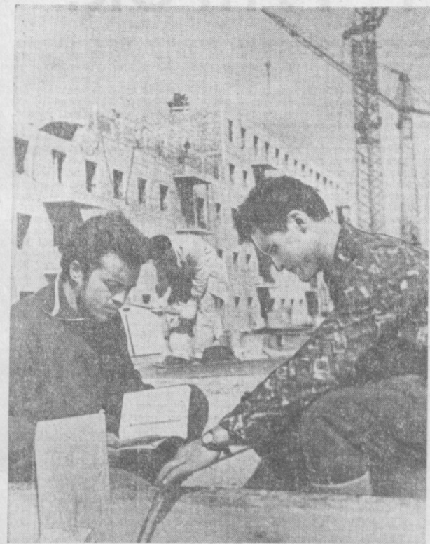
Чилонзорнинг 23-кварталда Москва биндан келган бинкорлар янги уй-жойларни бунёд қилишмоқда. Улар 12 000 квадрат метр уй-жой курашиш мажбуриятини олган. Улар янги йил арафасида беш унинг фойдаланишга топширишди, 1967 йили Энгельс кўчаси атрофидаги уй-жой ва маданий-маиший биноларни қуришди.